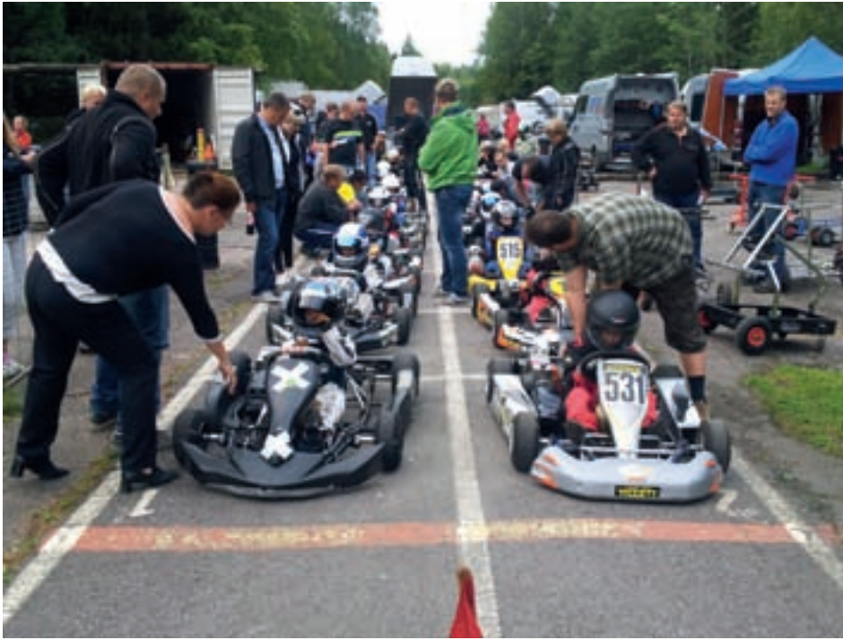
Tiistaiturnaus tunnelmaa elokuulta 2012, Cadett luokka lähtöruudukossa.

Uusia harrastajia on tullut mukaan todella ilahduttavan runsas määrä kuluneen kesän 2012 aikana. Etenkin Tiistaiturnausten jälkeisinä iltoina, on ollut jopa tilanne että eivät kaikki halukkaat päässeet itse kokeilemaan ajamista Bembölen radalla. Eikä nyt ole syynä vuokraautojen määrä, vaan 16:sta ensikertalaisen opastaminen ja ajattaminen samana iltana on jo haasteellinen tehtävä kenelle tahansa.