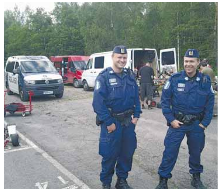
Espoolainen poliisipartio kävi 10. Heinäkuuta 2012 tutustumassa Bembölen rataa ja hymy tuntui nou- sevan kasvoille, kun pienet kuljettajat kurvailivat ympäri rataa.

Ystävälliset konstaapelit mittasivat jopa tutkalla no- peuksia ns. pääsuoralla kiitävillä autoilla. Nopeudet olivat sallituissa rajoissa n.55-83 km/h, ..siis varsin kovaa tuntuvat juniorit Bembölessä todistetusti me-