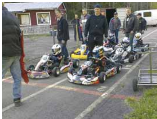
Cadet luokka valmistautuu kisa lähtöön Master auton johdolla ja huoltajat jännittävät omiensa puolesta