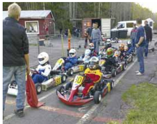
KF6 (60 cc moottori) luokka valmistautumassa Tiistaiturnausten osakilpailuun.