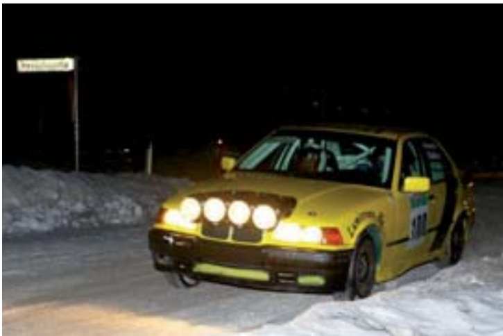
Jani Kujanpää (THU-Team)-Arto Viinikka, BMW 325