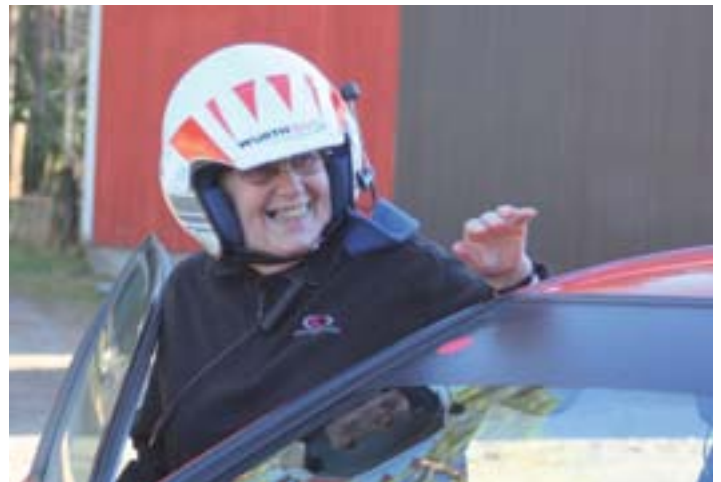
Taisi olla loistokyyti, kun noin hymyilyttää