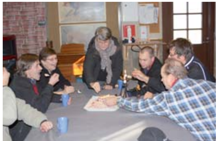
Pikiksen jälkeen. Yksi kakku, monta lusikkaa