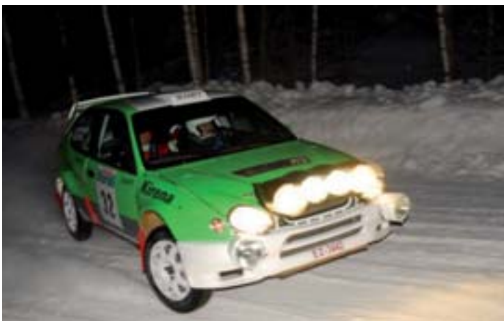
Seppo Kopra (HyUA)- Erkki Koskelo, Toyota WRC