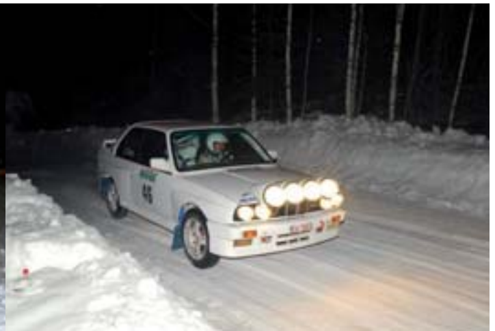
Sami Tiitta-Tuomas -Kyllönen (HyUA) BMW M3