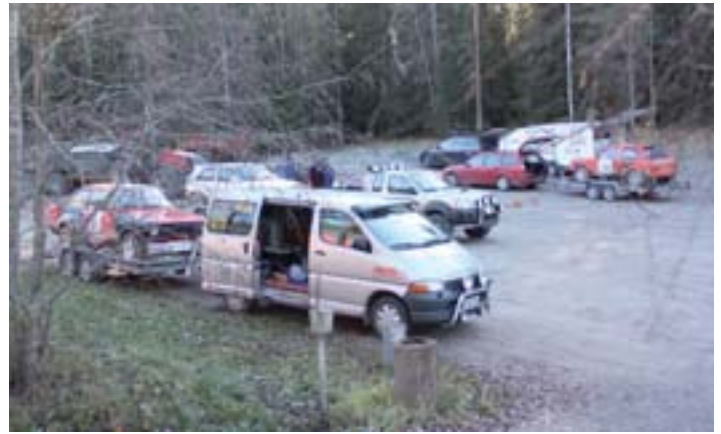
Saukkolan EKn varikko