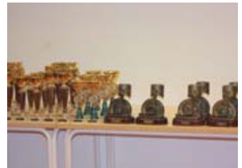
Komea palkintopöytä odottamassa menestyneitä kilpailijapareja