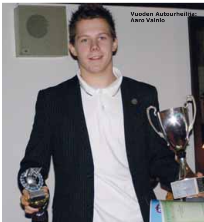
Vuoden Autourheilija: Aaro Vainio