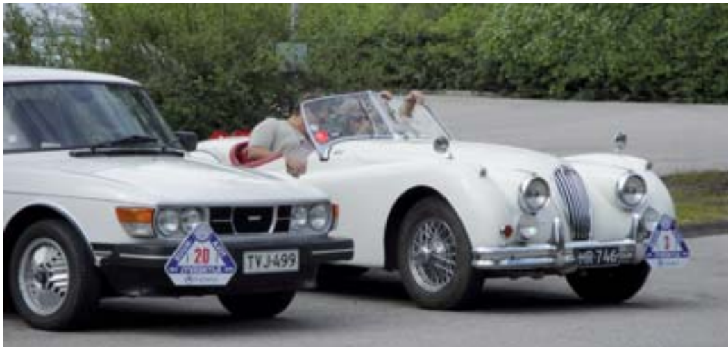
Kuosmasen avo Jagge on komea peli, autolla on mm ajettu Monte Carlo Historic ralli