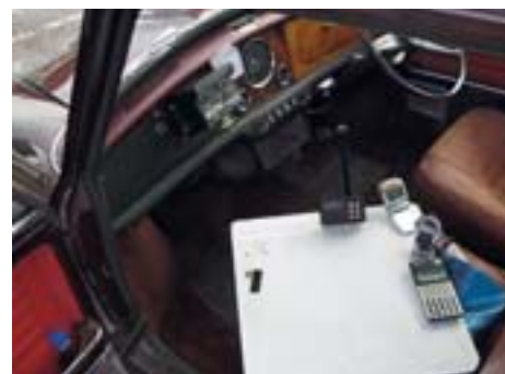
Göranin Rileyyn (=porrasperä mini) toimistokalusteet

Komeista maisemista jäi eniten mieleen Urrian iso töppyrä, nettitiedon mukaan kumpareta on jossain vaiheessa jouduttu madaltamaan metrillä koska bussit ovat jääneet mahastaan kiinni. On se vaan mahattava paikka.