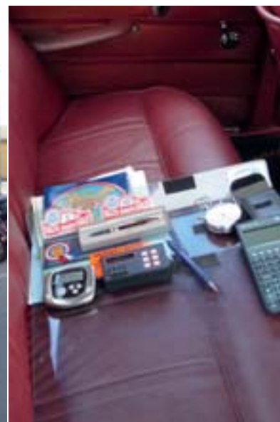
Markus Jahnin työpöytä