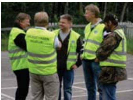
Kilpailun johtomiehet palaverissa