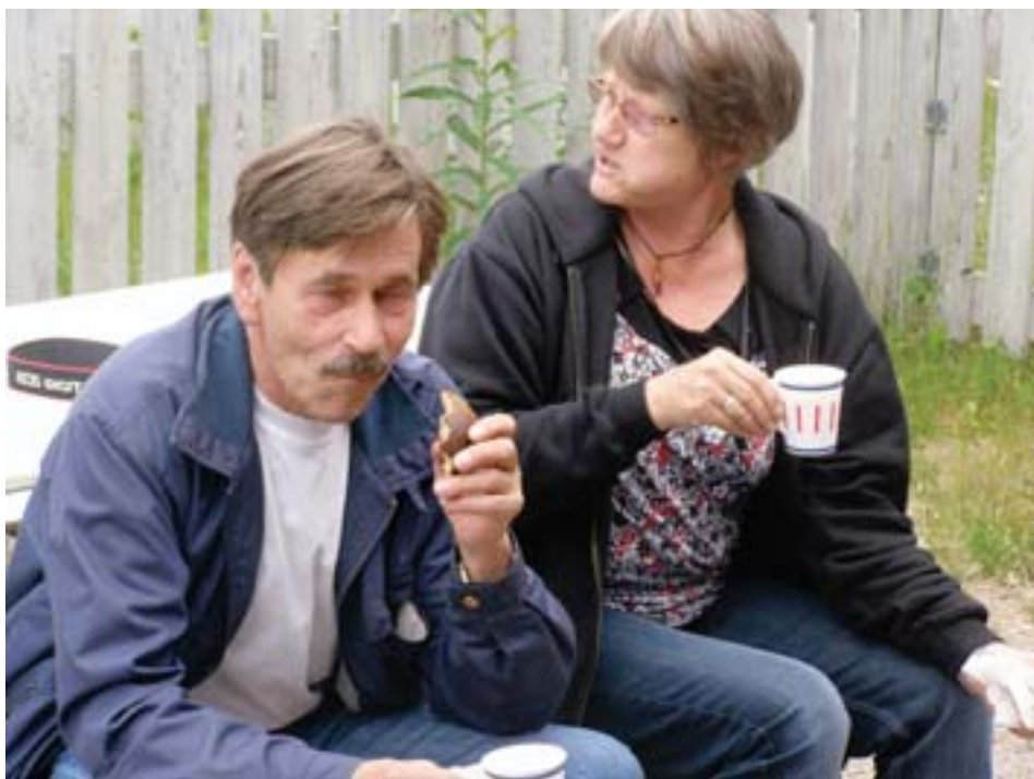
Rouva puheenjohtaja ukkeleineen kahvitaulla