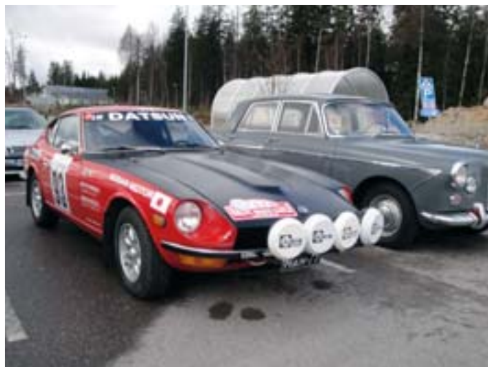
Monten kävijä Datsun Z240 (aito Kaukoitä-auto): Takana Wolseley tai miten sen britit kirjoittavatkaan?