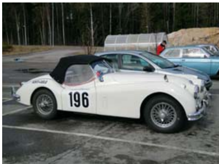
Kuosmasen Montessa käynyt Avo Jaguar sadevarustuksessa.