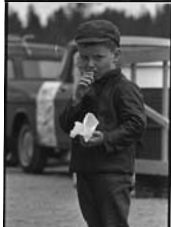
Keitähän kuvissa lienee, tunnetko?