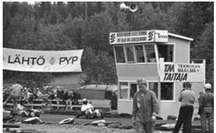
Radan ensimmäinen tornikin oli aika hieno, ja mainostajien kylttejä runsaasti ympäri rataa.