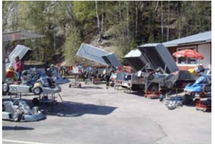
Varikkoalue erältä Kartingleiriltä 2000 luvun alusta.