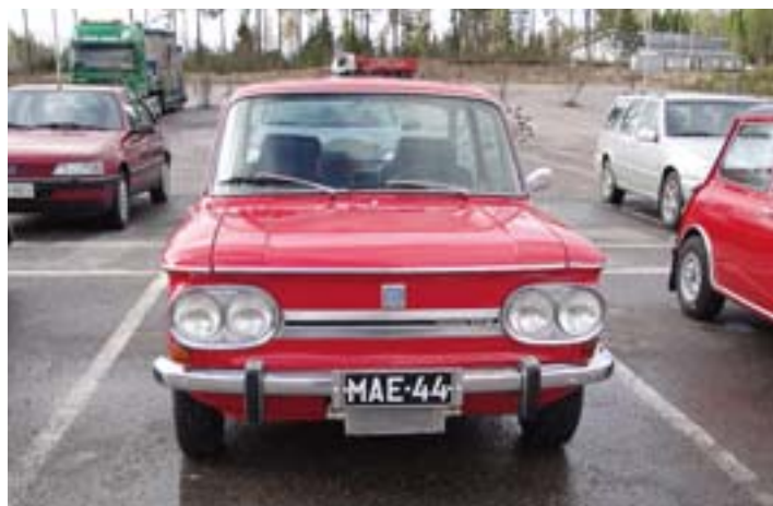
Voittajat: Esa Pihlaja-Kuhna ja Pentti Pihlaja-Kuhna, NSU 1000 TTS

Lisätietoja voit kysellä mm Lasse Fleegelta 0400 682 647