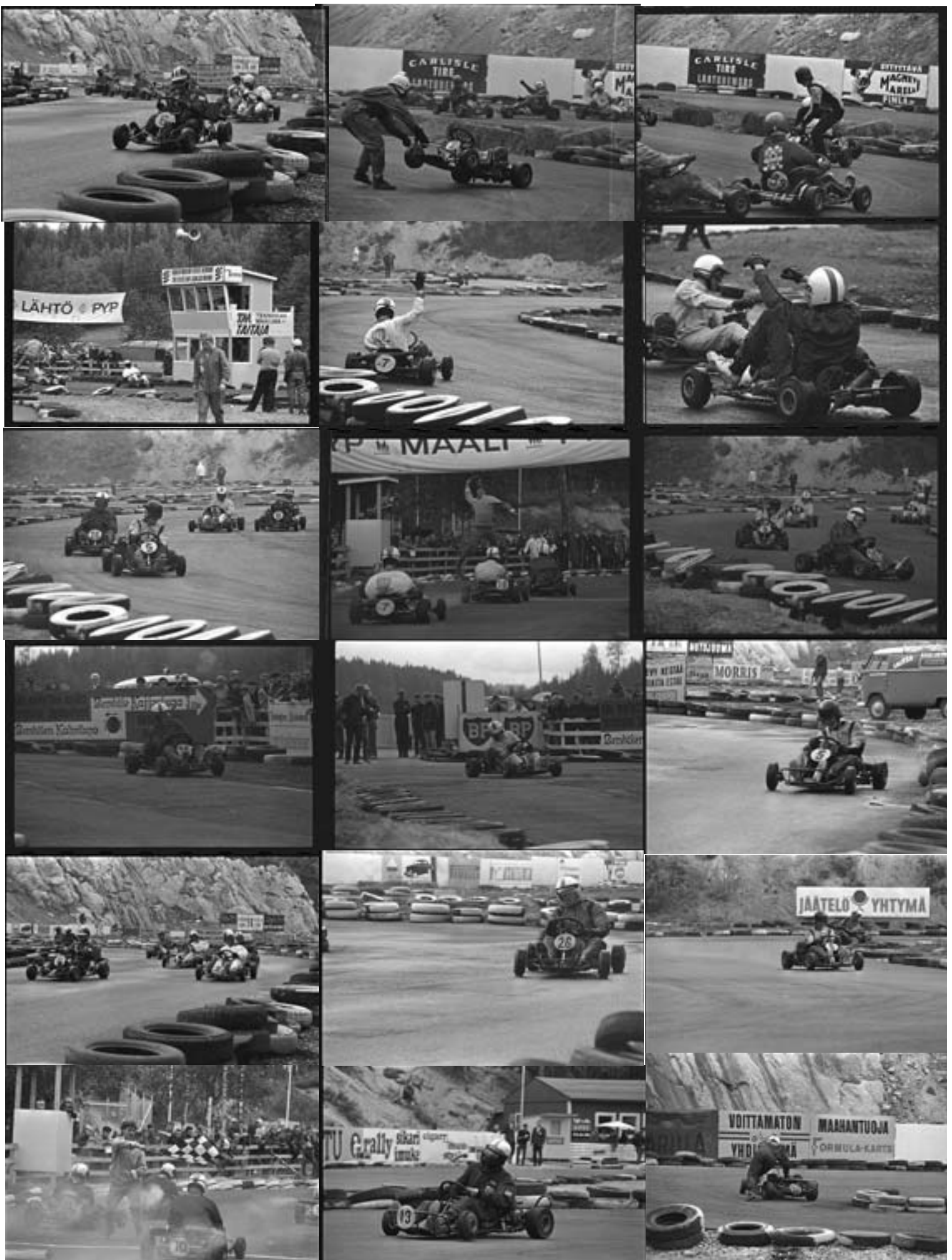
Kuvasarja eräästä Bemskin kisasta 1960 luvun lopulta. Kuvaajan nimeä ei tiedossa, mutta saattaa olla Holger Hoge Eklund. Ainakin samantapainen kuva julkaistiin Helsingin Sanomissa talvella 2010. Kuvat ovat negatiiveina Espoo UAn arkistossa