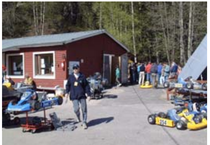
Kartingleireillä on ollut runsaasti osallistujia vuosien saatossa.