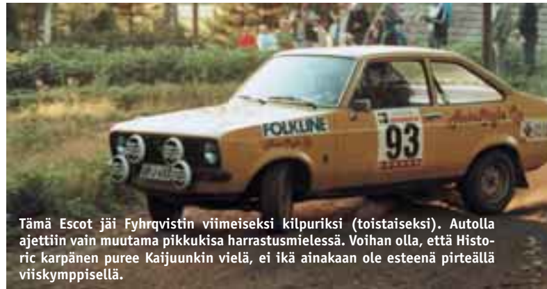
Tämä Escot jäi Fyrqvistin viimeiseksi kilpuriksi (toistaiseksi). Autolla ajettiin vain muutama pikkukisa harrastusmielessä. Voihan olla, että Historic karpänen puree Kaijuunkin vielä, ei ikä ainakaan ole esteenä pirteällä viiskymppisellä.