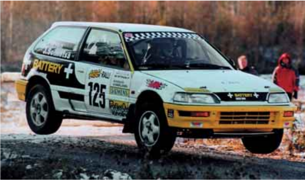
Jukka Soimetsä edustaa EspUA:ta kauden 2003 alusta. Jukka on erittäin nopea F-ryhmässä Hondalla kilpaileva etuvetokuski.