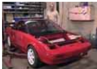
Erkki Koskela menestyi erinomaisesti etenkin asfaltilla kesän Sprintti-kilpailuissa