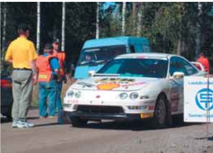
Rami Räikkönen on erittäin nopea rallikuljettaja ja tavoittelee ensi vuonnakin sekä nuorten että yleisen SM-mitaleita.

Tämänkin lehden kaikki rallikuvat ovat EspUA:n hovihankkijan Pro technic -fotoklubin kuvaamia