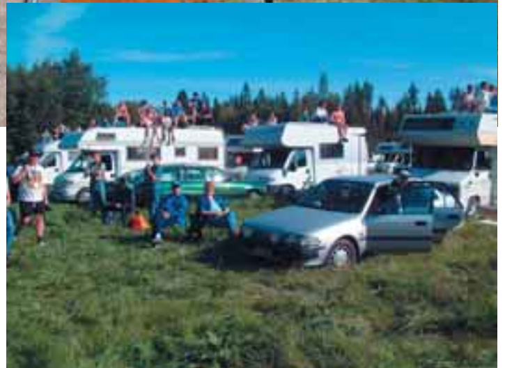
Asuntoauto on valttia katselijoiden keskuudessa.