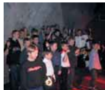
EspUA:n palkitut nuoret yhteikuvassa Serenassa pikkujoulujuhlissa.