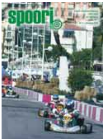
Spoori ilmestyi vuonna 2002 viisi kertaa ja lisäksi jäsenille lähetettiin kaksi erillistä tiedotetta.