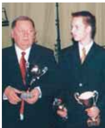
Vuoden taustavaikuttaja: Aatos Karjalainen