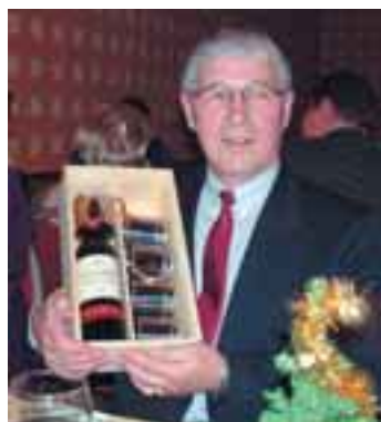
Spoorin toimituskunta nimettiin Vuoden UA:laiseksi