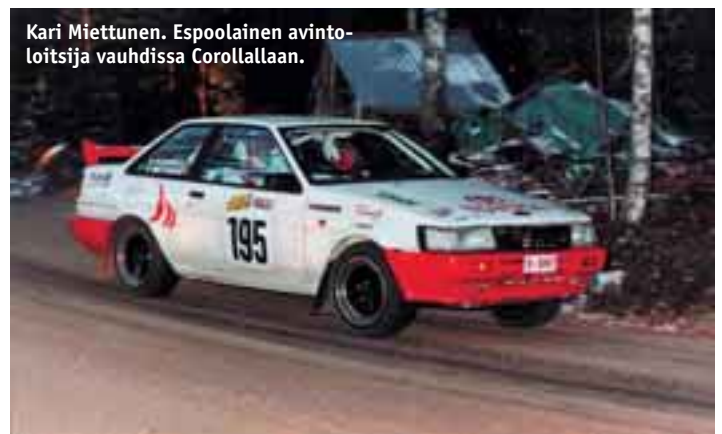
Kari Miettunen. Espoolainen avintoiltsija vauhdissa Corollallaan.

Tätä kisa tekemään tarvitaan taas jonkin verran porukkaa. Jos haluat olla mukana, uhrata yhden päivän autourheilulle, ota yhteyttä Antero Saarenpään puh. 050-309 6801 ja ilmoittaudu.