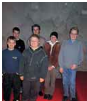
EspUA:han perustettiin nuorisotyöryhmä, joka järjestikin heti runsaasti ohjelmaa nuorisolle