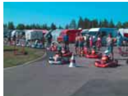
Spoori yritti järjestää jäsenille yhteiskuljetusta kartingin MM-kilpailuihin Alahärmään, mutta yhteiskyytti ei kelvannut. Tosin Alahärmään oli omin voimin saapunut ainakin 100 EspUA-laista

EspUA-Karting ajettiin Hyvinkään kartingradalla sunnuntaina 2.6.2002. Alun perin kaksipäiväiseksi suunniteltu kilpailu ajettiin vähäisen osanottajamäärän takia kuitenkin sunnuntaina yksipäiväisenä. Lauantaina oli koulujen päättäjät ja sen vuoksi ei osanottajia tietenkään lauantaille saatu.