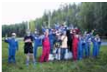
Tiistaiturnaukset jatkuivat elokuussa Bembölessä