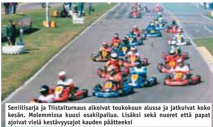
Seniisarja ja Tiistaiturnaus alkoivat toukokuun alussa ja jatkuivat koko kesän. Molemmissa kuusi osakilpailua. Lisäksi sekä nuoret että papat ajoivat vielä kestävyysajot kauden päätteeksi