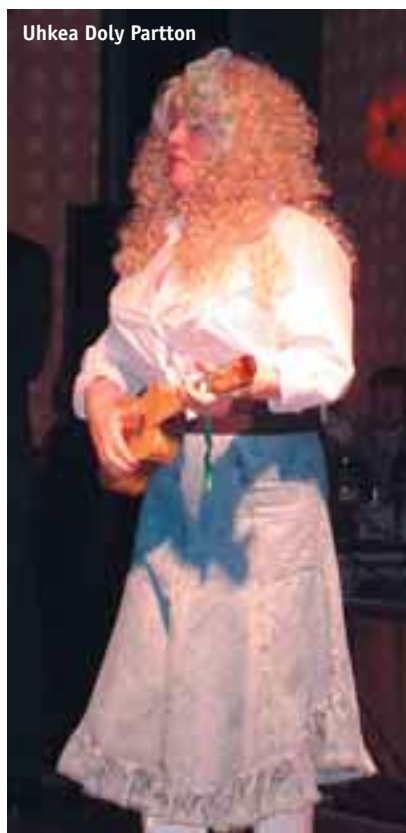
Uhkea Doly Partton