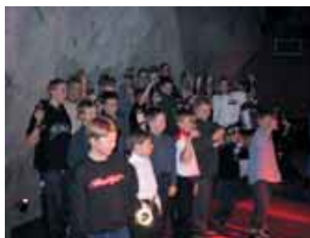
EspUA:n palkitut nuoret yhteiskuvassa