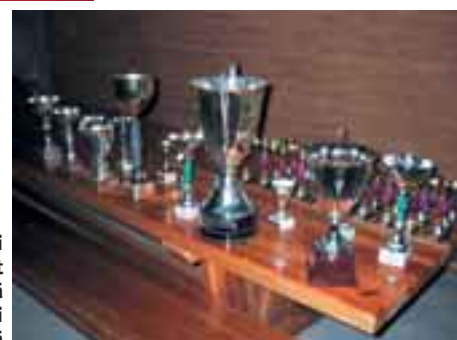
Kaikki pokaalit vielä kauniisti rivissä