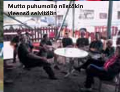
Mutta puhumalla niistäkin yleensä selvitetään