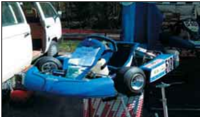
Cadet Raket 60 cc ja Gp runko Yhden kesän ajettu. Saavutukset mm: Aluemestaruus v. 2000 Hinta 9500,00 mk