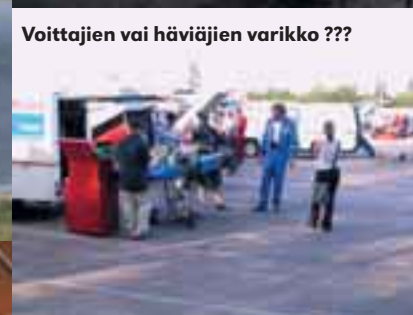
Voittajien vai häviäjien varikko ???