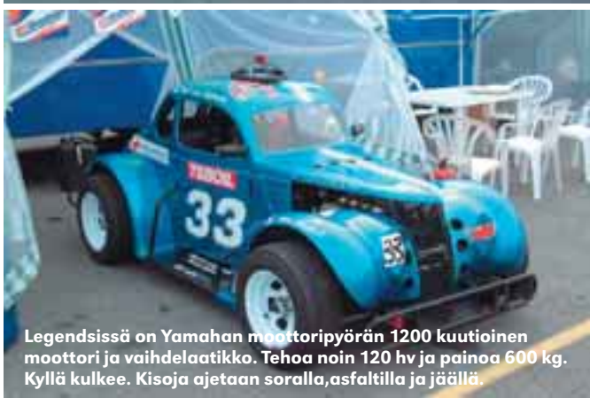
Legendsissä on Yamahan moottoripyörän 1200 kuutioinen moottori ja vaihdelaatikko. Tehoa noin 120 hv ja painoa 600 kg. Kyllä kulkee. Kisoja ajetaan soralla, asfaltilla ja jäällä.