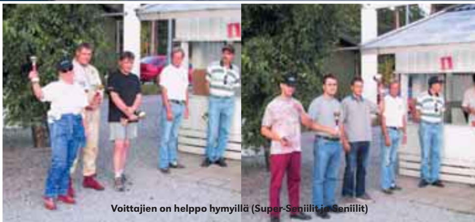
Voittajien on helppo hymyillä (Super-Seniilit ja Seniilit)

Seniilien startti onnistuu nykyään hyvin, toisin oli kymmenen vuotta sitten, kun kuskit ei millään malttaneet odottaa lipun heilahdusta ja startin jälkeiset "kasat" olivat yleisiä.