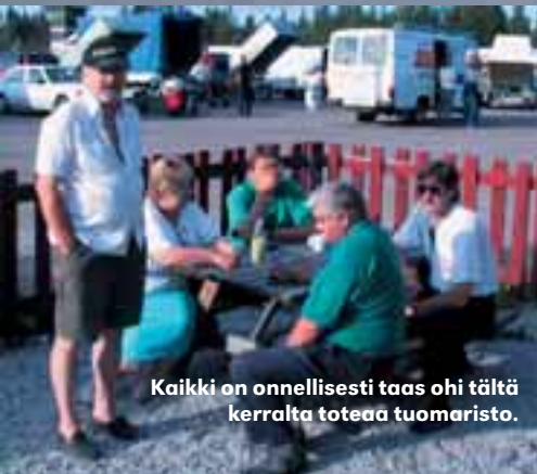
Kaikki on onnellisesti taas ohii tältä kerralta toteaa tuomaristo.