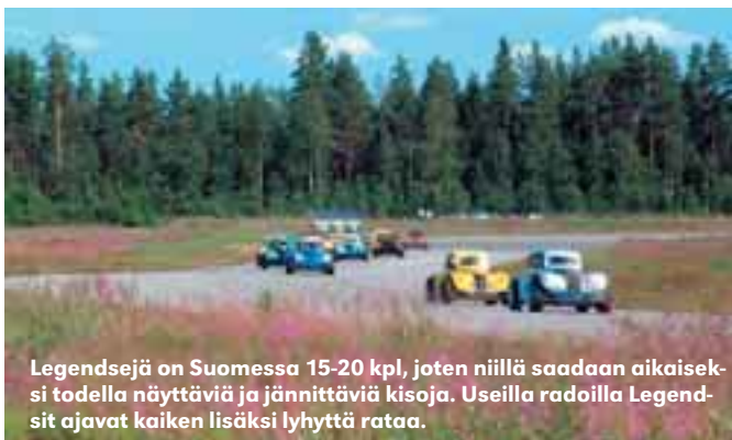
Legendsejä on Suomessa 15-20 kpl, joten niillä saadaan aikaiseksi todella näyttäviä ja jännittäviä kisoja. Useilla radoilla Legendsit ajavat kaiken lisäksi lyhyttä rataa.