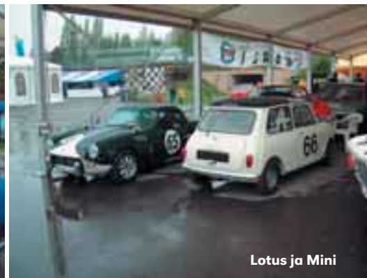
Lotus ja Mini