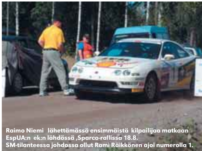
Raimo Niemi lähettämässä ensimmäistä kilpailijaa matkaan EspUA:n ek:n lähdössä Sparco-rallissa 18.8. SM-tilanteessa johdossa ollut Rami Räikkönen ajoi numerolla 1.

EspUA järjesti 18.8 ainakin yhden Ek:n Sparco-rallissa. Ek kakkosella vietettiin lähes koko lauantaipäivä, sillä kilpureita oli mukana lähes 260 autoa ( nuoret ja naiset ajoivat ek:n kahteen kertaan ). Järjestelyt onnistuivat loppujen lopuksi hyvin, vaikka aluksi tekijöitä kerääntyi Pornaisten Essolle todella vähän.