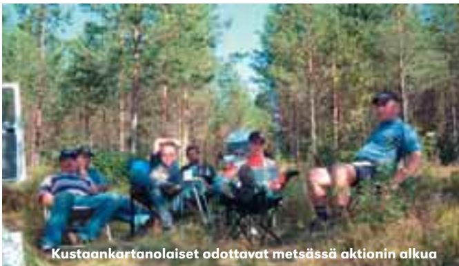
Kustaankartanolaiset odottavat metsässä aktionin alkua