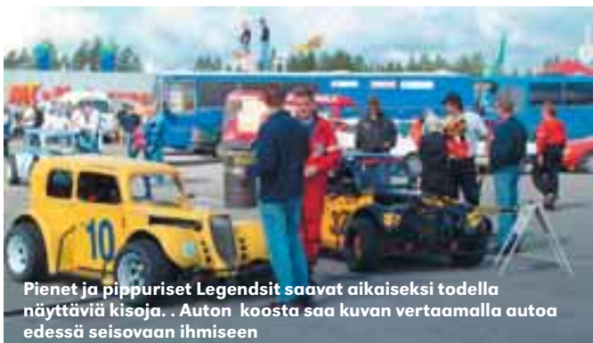
Pienet ja pippuriset Legendsit saavat aikaiseksi todella näyttäviä kisoja. Auton koosta saa kuvan vertaamalla autoa edessä seisovaan ihmiseen