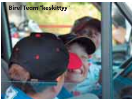
Birel Team "keskittyä"