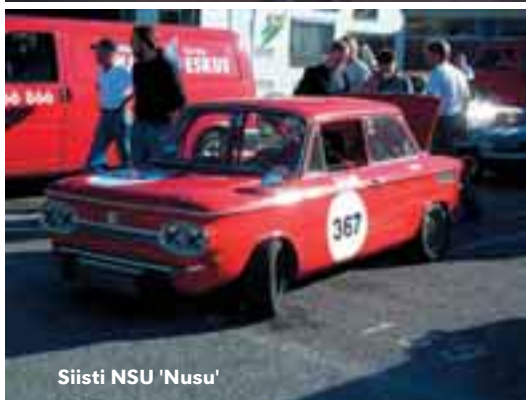
Siisti NSU 'Nusu'