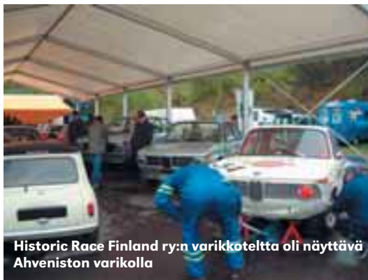
Historic Race Finland ry:n varikkotelta oli näyttävä Ahveniston varikolla