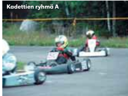
Kadettien ryhmä A