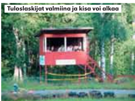
Tuloslaskijat valmiina ja kisa voi alkaa