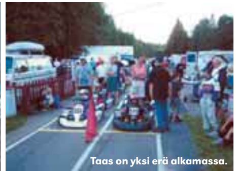
Taas on yksi erä alkamassa.