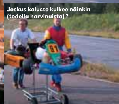
Joskus kalusto kulkee näinkin (todella harvinaista) ?