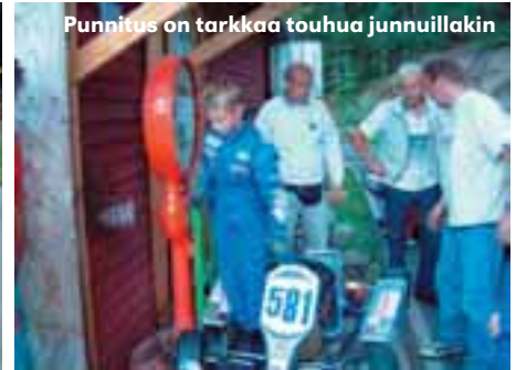
Punnitus on tarkkaa touhua junnuillakin