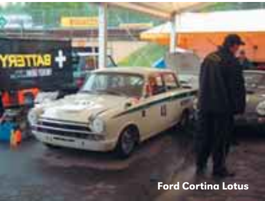
Ford Cortina Lotus