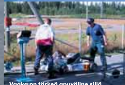
Vaaka on tärkeä apuväline sillä jokainen gramma on liikaa