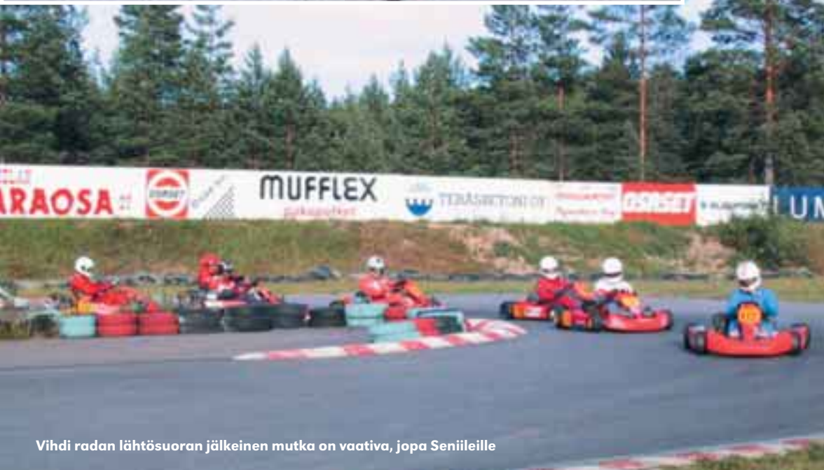
Vihdi radan lähtösuoran jälkeinen mutka on vaativa, jopa Seniileille