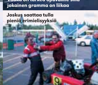
Joskus saattaa tulla pieniä erimielisyyksiä