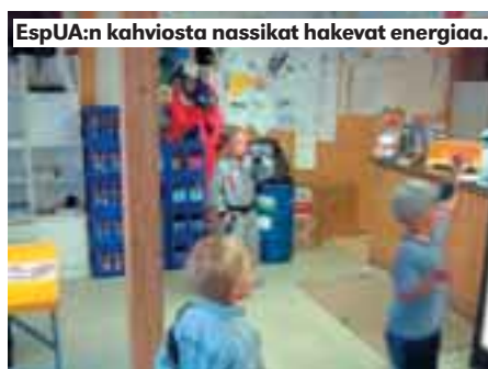
EspUA:n kahviosta nassikat hakevat energiaa.