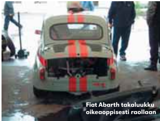
Fiat Abarth takaluukku oikeaoppisesti raollaan