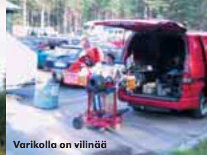
Varikolla on vilinää